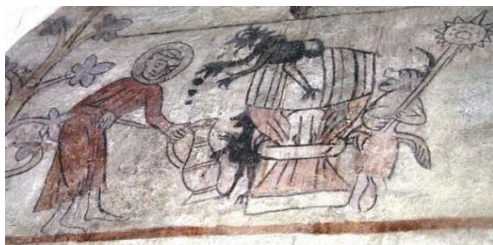
Ørslev Kirke. Munk tapper øl eller vin

Og i Ørslev kirke, Vordingborg, står en munk også med en spunskniv i hånden og tapper øl eller vin fra en tøndne.