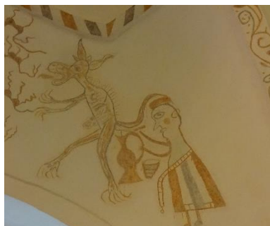
Ørbæk Kirke. Heksen og djævlen

og så er det lige pludselig, at det bliver endnu mere spændende at vende tilbage og kigge på maleriet i Ørbæk kirke. For læg mærke til at personen i Ørbæk også – besynderligt nok – har en spunskniv i hånden, selv om det ikke er en tønde, han tapper fra, og at de krukker væsken opsamles i, er helt identiske på de tre malerier.