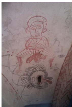
Mørke Kirke. Mandsfigur

I 1932 genfandt man maleriet i Ørbæk ved en restaurering, men menighedsrådet fandt det dengang anstødeligt, og det blev igen malet over. Det var der for så vidt heller intet usædvanligt i, og det er heller ikke ualmindeligt den dag i dag, at nyopdagede kalkmalerier overmales. I Mørke Kirke har man i 2013 således fundet et billede, der