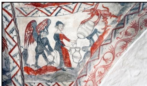
Tuse kirke. En bryggerspige hjælpes af djævel

Djævelen kunne altså også spille med, når der skulle laves vin, selv om han ikke kan skabe den – kun Gud kan jo skabe ting, Djævelen kan derimod lave om på dem. Og få meter fra maleriet af smørpigen i Tuse kirke er der netop et andet kalkmaleri af en pige, der står med en spunskniv (redskab til at tappe øl fra spunsen af tøndnen) og tapper øl eller vin fra en tøndne.